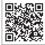
ダウンロード資料館

2023年から、『マナテックカレンダー』は皆さまのビジネスのお役に立つ情報に特化してお届けしています。印刷物としてご注文品の配送時に同梱しておりますが、SNSやメールでシェアしやすいデジタル形式でもご用意しております。以下のQRコードからダウンロード資料館に飛び、日本語ページで『マナテックカレンダー』と検索してみてください。